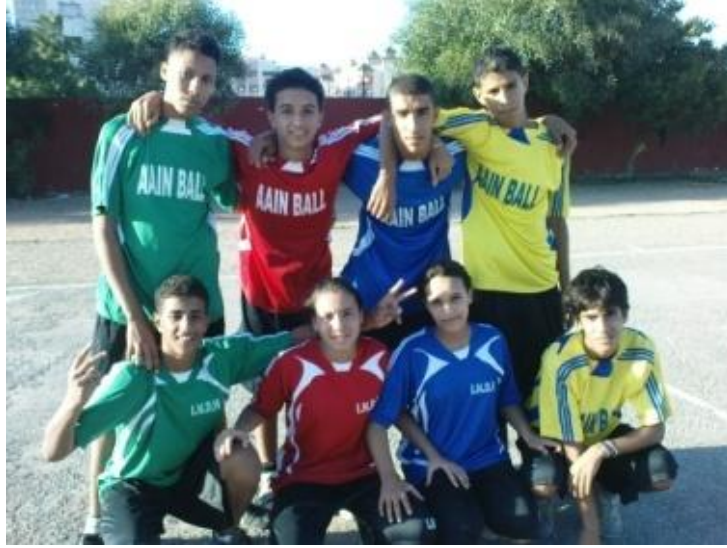
الشكل رقم (1)

ولهذا نجد أن جل الفتيات ينجدين نحو الرياضات الفردية مثل التنس والسباحة وبعض فنون الحرب. أما بالنسبة لرياضة كرة العين فوجدن فيها ذاهن حيث يمارسها بحرية وطلاقة وبحماس دون الوقوع في مشكل الاختلاط رغم انه قائم وربما مقصود في بعض الأحيان بل في جلها وللضرورة. فلا نجد تفاوت في الطاقات بين اللاعبين عند كل عملية اخذ الكرة أو استلامها. لكن تبقى المهارات الفردية لكل لاعب ولاعبة هي المرتكز في نيل عدد اكبر من النقاط وعدم السقوط في فخ الأخطاء.