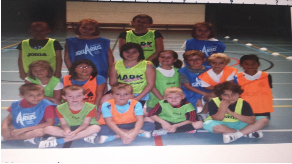
الشكل رقم (5)

وبارتفاع درجة التركيز لاحظنا أن طريقة اللعب وتمهير الكرات واكتساب النقط هي أيضا تغيرت لان المسألة مرتبطة بالدماغ فكلما كان الدماغ مركزا كانت نتائج العمل ايجابية وجيدة