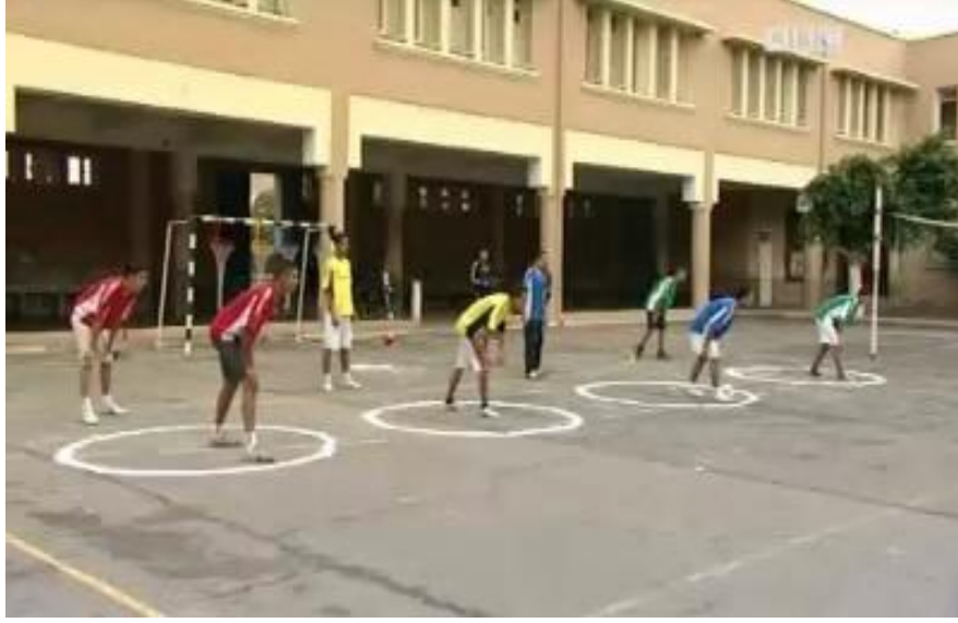
الشكل رقم (2)