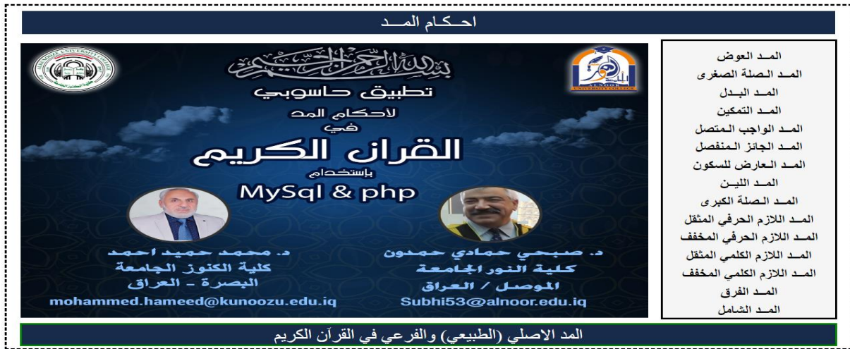
شكل رقم 1: شاشة واجهة البرنامج الرئيسية

لغرض تسهيل عملية البحث في قاعدة البيانات ولإيجاد أحكام المدود وأنواعها ومواضعها فقد صممت الواجهة الرئيسية شكل (1) والتي يمكن أن تستدعى من الرابط http://localhost/quran/qmad . php حيث تتكون من (14) اختياراً تتفرع كل منها إلى اختيارات حسب نوع المد وحكمه. وقبل الحديث عن برمجة هذه الاختيارات في واجهة البرنامج سوف نتطرق الى لمحة بسيطة عن كل نوع من المدود وأنواعه وأسبابه وأقسامه التي ستطبق في هذا البرنامج.