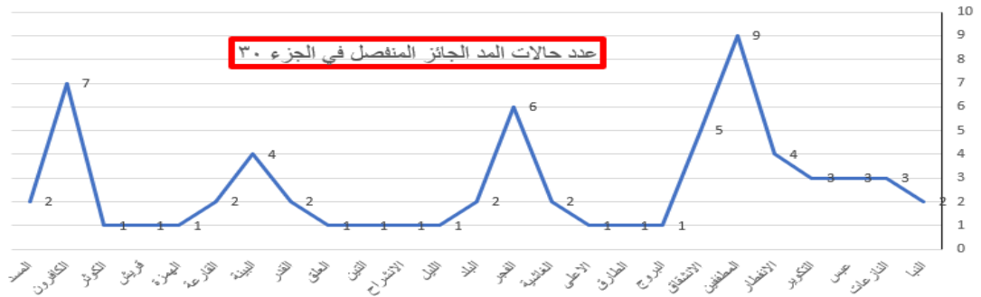
مخطط رقم 1: اعداد حالات المد الجائز المنفصل في الجزء 30

المخطط (1) يوضح اعداد حالات المد الجائز المنفصل في الجزء (30) حسب السور التي توجد فيها حالة المد.