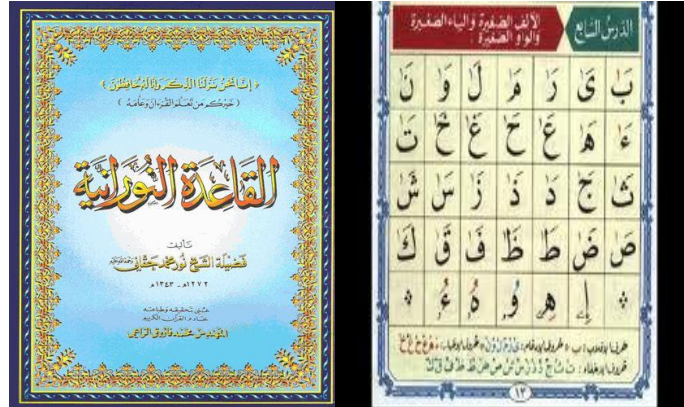
شكل 2: القاعدة النورانية

هذا البرنامج يدرس للطلبة خاصة غير الناطقين منهم الذين لا يجيدون قراءة القرآن، فكل من يجد صعوبة في النطق عند قراءة القرآن كما ينبغي، أو قاعدة التشكيل سواء كانت الفتحة أو الضمة أو الكسرة أو التنوين أو السكون أو الشدة، وهذه القاعدة تعرض عن طريق الكاسيت المسجل أو C-D بالحاسوب، والقاعدة تكون أمامك وتتلقى الدرس تلو الدرس بلا زيادة ولا نقصان، ثم تطبق الدرس حتى تكمل المساق، وهذه المادة متوفرة على شكل أشرطة و C-D [2].