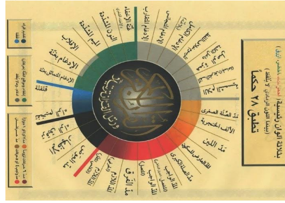
شكل6:مصحف التجويد الملون وشرح للألوان المتعلقة بأحكام التجويد