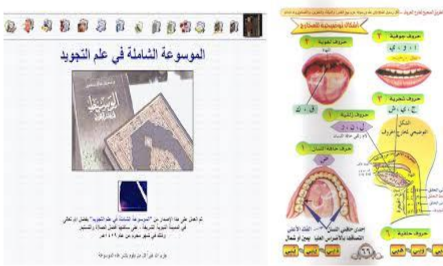
شكل 4: برنامج الموسوعة الشاملة في التجويد وصورة توضيحية لمخارج الحروف

كما يمكن للمستخدم معرفة معاني الصفات عن طريق شاشة مستقلة، ومعرفة عدد الصفات لكل حرف على حدة 5- رسوماً توضيحية تشريحية لأجزاء الفم واللسان، بما تمكن المستخدم من معرفة الأجزاء العلمية لمواقع الحروف.[1]