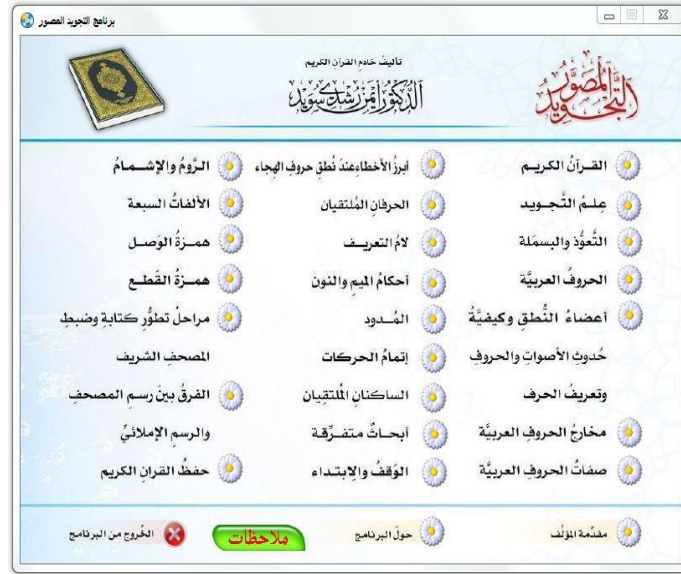
شكل 5: برنامج التجويد المصور وأقسامه