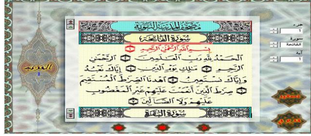
شكل 1: المنشاوي المعلم لأحكام التجويد